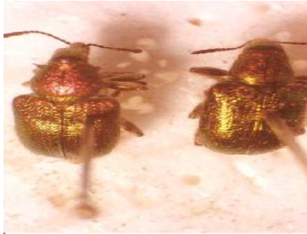
شکل 3: حشرات کامل نر (چپ) و ماده (راست) سرخرطومی گیلاس (مقیاس 1