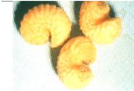
شکل 1: لارو زمستانگذران سرخرطومی گیلاس R. auratus (مقیاس 1 میلیمتر)

بطور متوسط 4/2 روز بطول می انجامد. طول مدت شفیرگی 30 تا 35 روز و متوسط 29/4 روز می باشد. همچنین طول عمر حشرات کامل بین 35 تا حداکثر 60 روز و بطور متوسط 44/3 روز در شرایط آزمایشگاهی ( 1 \pm 25 ) درجه سانتیگراد و رطوبت 40 تا 50 درصد) ثبت گردید. در شرایط طبیعی تخم ها پس از یک هفته تا 10 روز تفریخ و لارو سن اول پس از 24 ساعت وارد هسته گیلاس می شود. لارو پس از تغذیه از محتویات هسته گیلاس بمنظور ادامه چرخه زندگی و سپس زمستانگذرانی وارد خاک می شود. طول مدت لاروی بین 18 تا 20 ماه طول می کشد و لذا یک نسل آفت در مدت 2 سال طی می شود (7)..