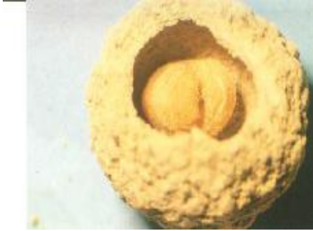
شکل 2- لارو زمستانگذران سرخرطومی گیلاس درون لانه گلی R. auratus