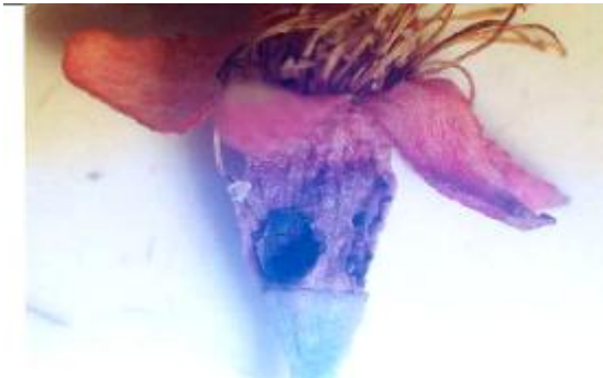
شکل 5: خسارت سرخرطومی گیلاس روی گل و کاسبرگ (مقیاس 1 میلی‌متر)

میزان آلودگی گیلاس و آلبالو به آفت سرخرطومی گیلاس تقریباً یکسان است ضمن اینکه با توجه به اختلاف زمانی ظهور گل‌ها و میوه در ارقام مختلف گیلاس و آلبالو، و ظهور زودتر میوه‌های آلبالو، معمولاً پس از رنگ انداختن میوه آلبالو، حشرات کامل آفت عمدتاً بر روی سایر ارقام گیلاس منتقل و اقدام به تخم‌گذاری و تغذیه می‌نمایند. فلذا در مناطقی که آلبالو در جوار گیلاس است میزان خسارت آلبالو بیشتر به نظر می‌رسد. تغذیه حشرات کامل سرخرطومی گیلاس از زردآلو، آلو و بادام بصورت قلوه کن از گوشت میوه بوده و هیچگونه تخم‌گذاری روی میوه‌های مذکور مشاهده نمی‌شود.