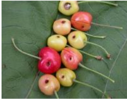
شکل 6: آثار خسارت سرخرطومی گیلاس R. auratus