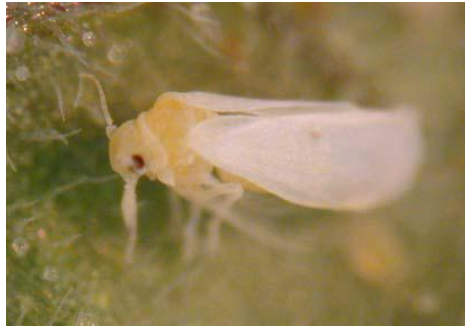
شکل ۳. تصویر حشره ناقل ویروس پیچیدگی برگ زرد گوجه فرنگی (Polstone and Lapidot 2007) ( B. tabaci ).