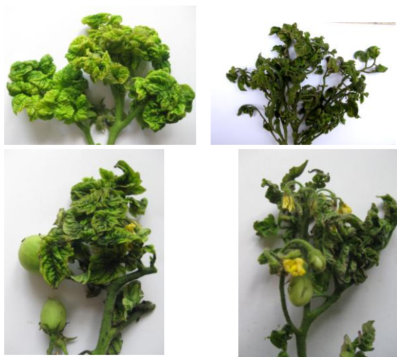
شکل یک. نشانه‌های پیچیدگی و ریزش شدن برگ‌ها در گوجه‌فرنگی آلوده به ویروس (TYLCV) (جیرفت و بهبهان).

برگ‌های انتهایی و در نهایت کوتولگی بوته‌های گوجه‌فرنگی ظاهر می‌شود (شکل ۱). در صورت آلودگی نشاهای گوجه‌فرنگی بلافاصله بعد از انتقال آنها به زمین اصلی، نشانه‌های آلودگی با سرعت بیشتری ظاهر گشته و شدت آلودگی در این گونه مزارع نیز بیشتر می‌باشد (Diaz-Pendon et al. , 2010).