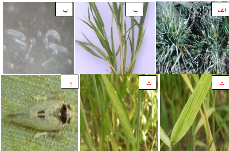
شکل 2- الف- علائم آلودگی به ویروس کوتولگی گندم، ب-علائم موزاییک رگه‌ای گندم، پ- پوره های کنه A. tulipae ، ت-علائم موزاییک ایرانی ذرت در گندم، ث-علائم موزاییک زرد نواری جو در گندم و ج- زنجبرک L. striatellus ناقل اصلی موزاییک ایرانی ذرت و موزاییک زرد نواری جو